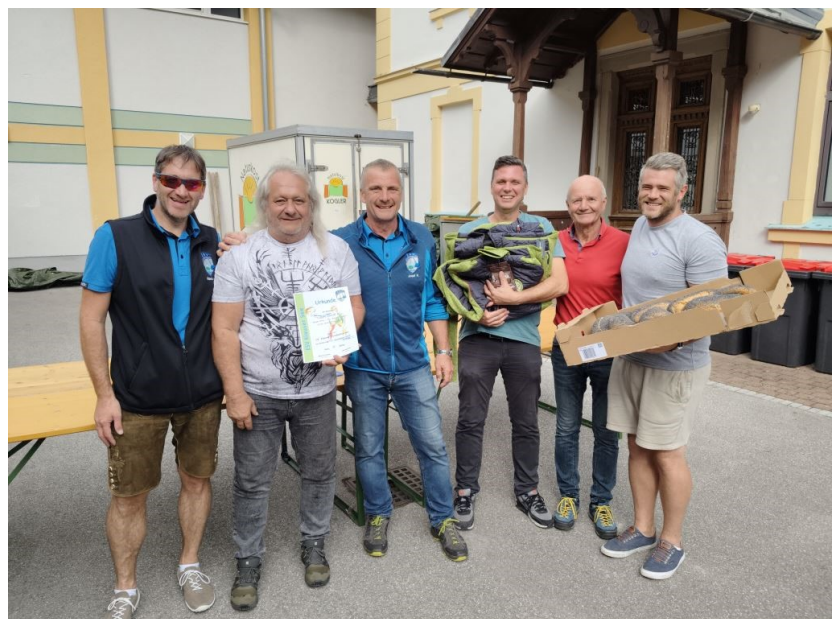
Die Sieger-Moarschaft „Cafe Sorelle I“

Der ESV Klausur See bedankt sich bei der Gemeinde Klaus und den Sponsoren für die Unterstützung und bei den Anrainern für das Verständnis der Straßensperre zu einer einmaligen Sportveranstaltung! Wir freuen uns bereits auf das 14. Klausur Straßenturnier im Jahr 2026.