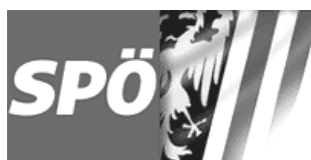
Fraktionsvorsitzende Inge Forster